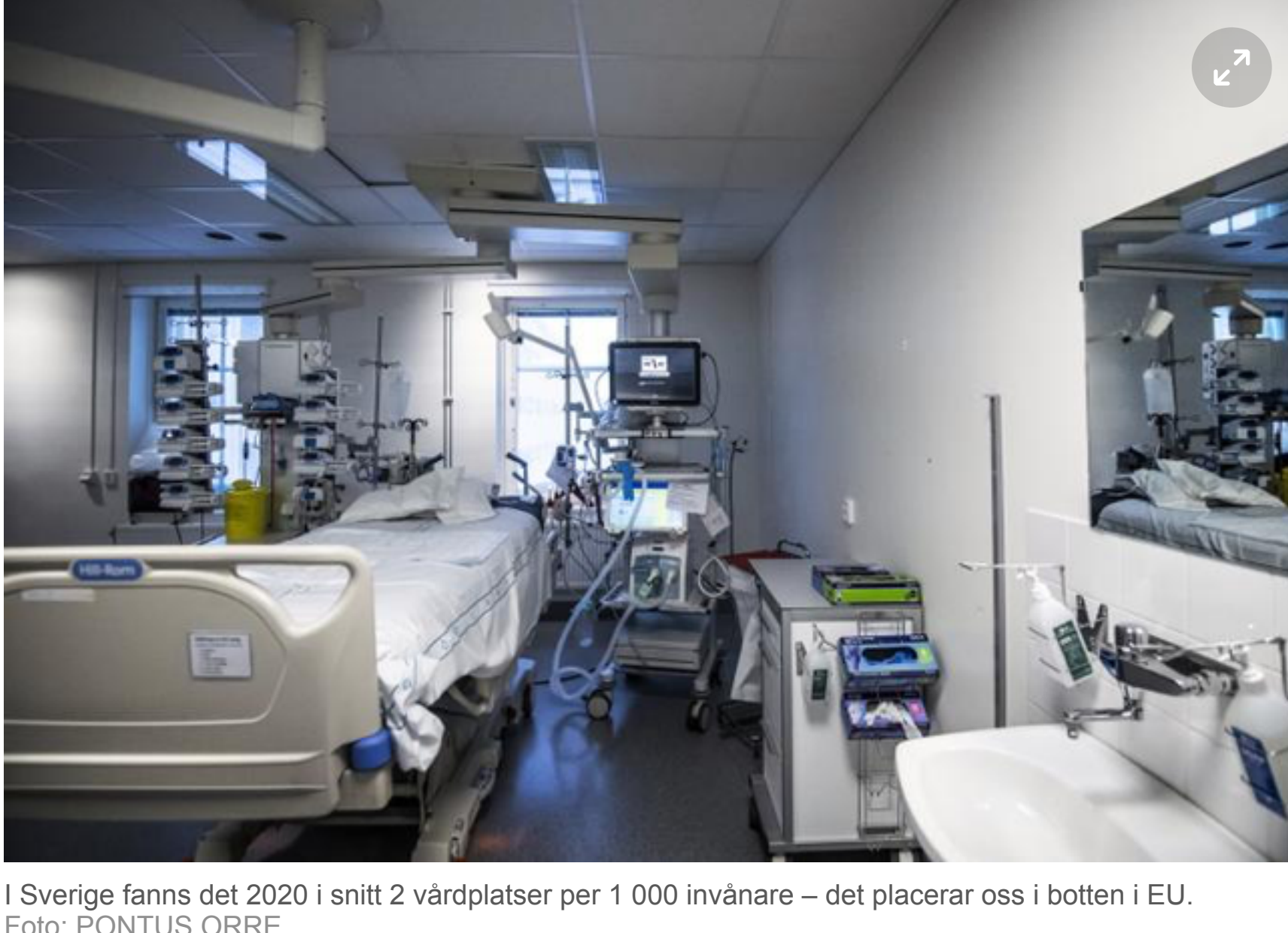
I Sverige fanns det 2020 i snitt 2 vårdplatser per 1 000 invånare – det placerar oss i botten i EU.

För den som har studerat statistik kan det knappast någon överraskning att coronan fick sjukvården att nära sig bristningsgränsen. I Sverige fanns det 2020 drygt 2 vårdplatser per 1 000 invånare. Det är en minskning med nästan 25 procent på 10 år, och med den siffran intar Sverige en bottenplacering i EU. Snittet i unionen är över 5 platser per 1 000 invånare.